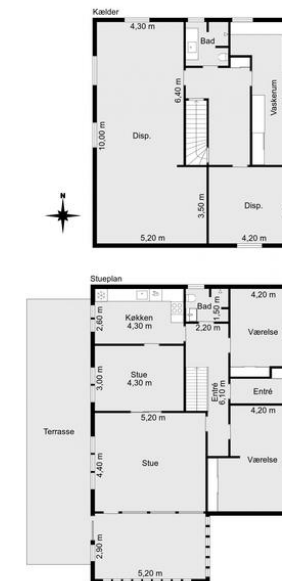
Vejledende plantegning uden ansvar